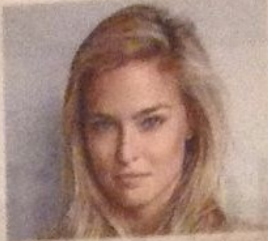
Bar Rafaeli Modelo

Carlos Núñez ha sido galardonado en Buenos Aires con el Premio Rosa dos Ventos 2015, que es otorgado anualmente por alumnos de 5 de Bachillerato del Instituto Santiago Apóstol de la capital argentina.