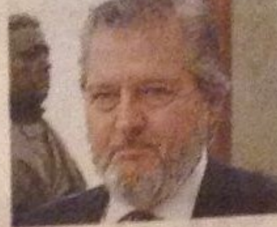
Íñigo Méndez de Vigo Ministro de Cultura

Israel cerrará el jueves el espacio aéreo sobre uno de los bosques del norte del país, en una medida sin precedentes que despertó la indignación de numerosos israelíes. La razón: la boda de la modelo Bar Rafaeli.